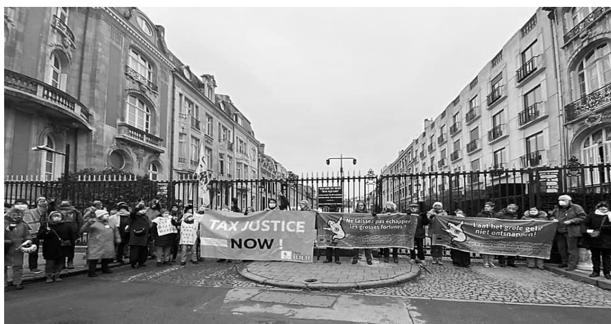
Le 5 janvier 2021, la coalition fiscale et le RJF/FAN à l'Impasse des Milliardaires - BXI

Avec ce « virus des inégalités », Oxfam redoute de voir celles-ci se creuser en raison du Covid. Les jeunes, les personnes issues de l'immigration et les femmes sont en première ligne. Pour faire face, Oxfam exhorte les gouvernements à mettre l'accent sur la lutte contre les inégalités, dans leurs plans de relance. Plusieurs pistes sont avancées : rendre la fiscalité plus redistributive, l'impôt sur la fortune, la taxe sur les transactions financières, la lutte contre l'évasion fiscale ... « Un impôt sur les bénéfices excédentaires engrangés par les multinationales au cours de la pandémie pourrait générer 104 milliards $ », calcule Lucas Chancel, codirecteur du laboratoire sur les inégalités mondiales à l'École d'économie de Paris. 1